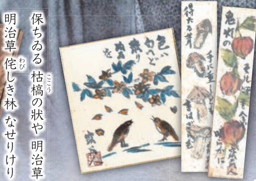
保ちある 枯槁の状や 明治草 明治草 侘しき林なせりけり